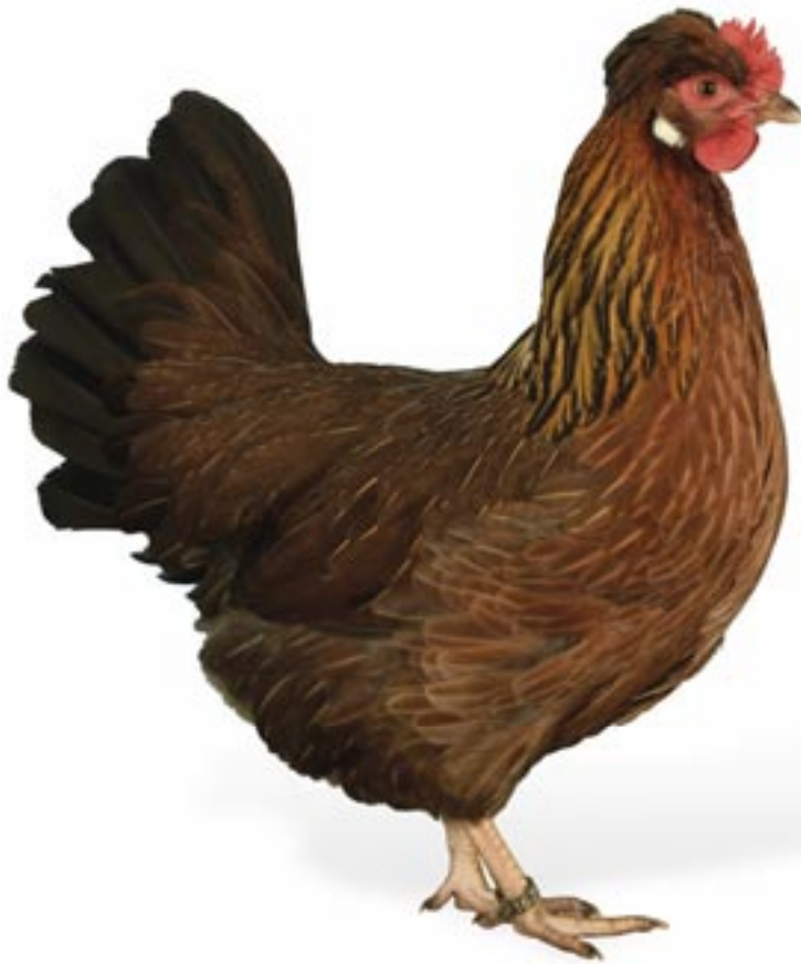
Altsteirer Huhn wildbraun